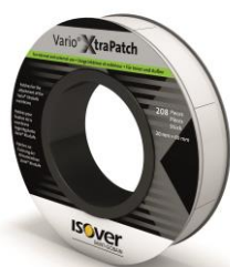
Obr. 1 ISOVER VARIO® XtraPatch