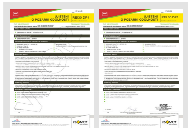
Obr. 6, 7: Príklad pracovného Uistenia o požiarnej odolnosti určeného na komunikáciu v období spracovania projektu a finálneho Uistenia o požiarnej odolnosti určeného pre kolaudáciu stavby.

Predmetné Uistenie o požiarnej odolnosti je prioritne určené pre doloženie požiarnej odolnosti v procese kolaudácie stavby. Vystavuje sa však aj tzv. pracovná verzia s vodotlačou a bez podpisu na účely komunikácie medzi projektantom, investorom a realizačnou firmou, popr. zástupcom štátneho dozoru. Táto pracovná verzia sa môže v priebehu projektu aj niekoľkokrát meniť a všetci zúčastnení tak majú k dispozícii pracovný dokument dokladajúci, že v uvedenom vyhotovení strecha zodpovedá vydané požiarnej klasifikácii a požiarne odolnosť bude formou opečiatkovaného a podpísaného Uistenia o požiarnej odolnosti doložená aj pri kolaudácii. Originály protokolov o skúškach a jednotlivé expertízy a požiarne klasifikácie, na základe ktorých bolo Uistenie o požiarnej odolnosti vystavené, sú k nahliadnutiu v divízii ISOVER.