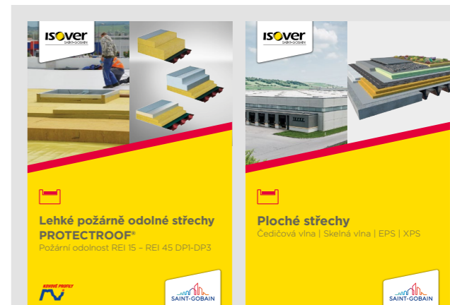
Obr. 10, 11: Podrobné projektové podklady pre navrhovanie - Lahkých požiarne odolných striech PROTECTROOF®, ISOVER pre systémy plochých striech.

lade odovzdanej informácie môže navrhnuť strechu, ktorá je v rozpore s vydanou požiarou klasifikáciou a na ktorú žiadne zodpovedajúce požiarne skúšky vykonané neboli. V konečnom dôsledku tak žiadnu doloženú požiarou odolnosť nemá a môže byť pri požiari aj veľmi nebezpečná.