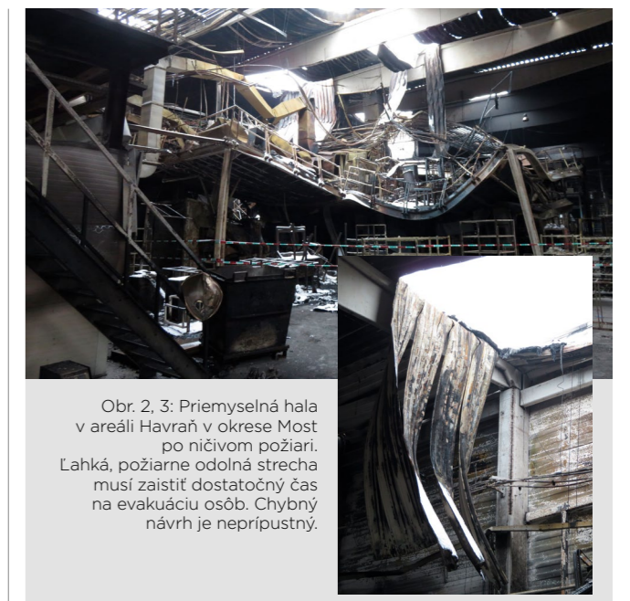
Obr. 2, 3: Priemyselná hala v areáli Havraň v okrese Most po ničivom požiari. Ľahká, požiarne odolná strecha musí zaistiť dostatočný čas na evakuáciu osôb. Chybný návrh je neprípustný.