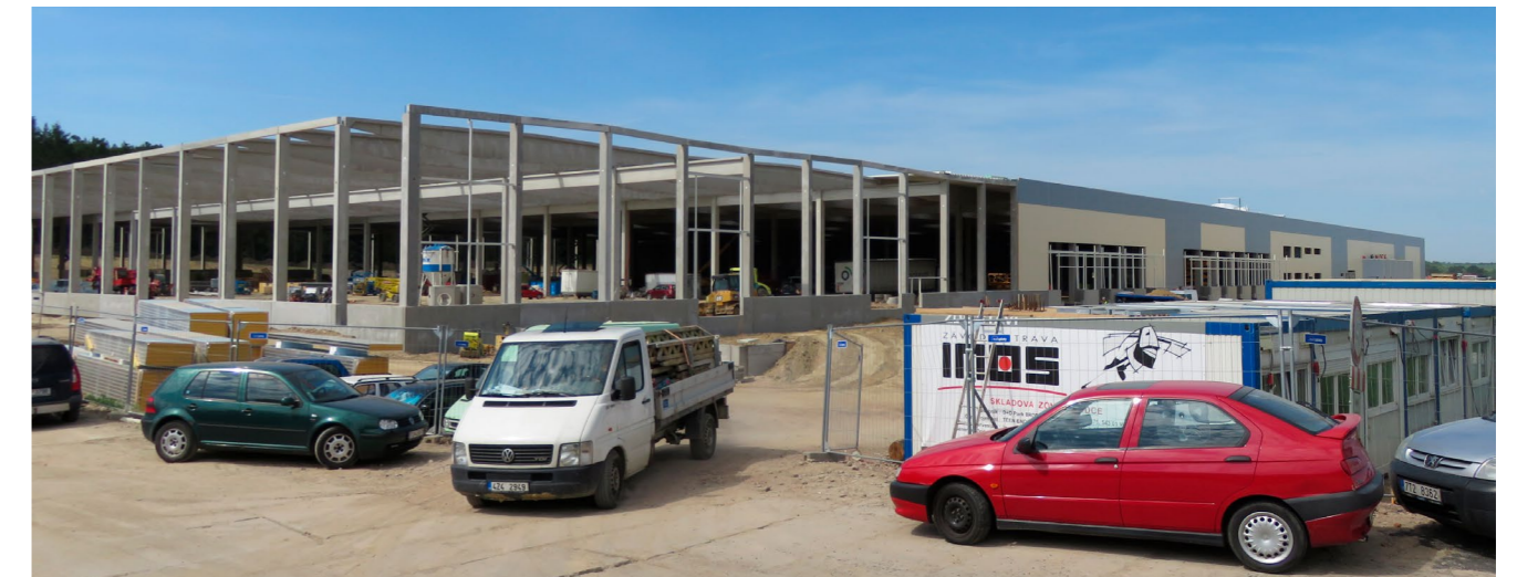
Obr. 1: Moderné halové novostavby sa štandardne navrhujú s ľahkou požiarne odolnou strechou na trapézovom plechu

Nároky na požiarne bezpečnosť stavieb podobne ako v iných odvetviach priemyslu ustavične stúpajú. Ľahké požiarne odolné strechy na trapézovom plechu, ktoré sú základným riešením moderných halových objektov, sa dnes takmer štandardne navrhujú s požiarou odolnosťou. Firiem, ktoré majú k dispozícii skladby s nejakou požiarou odolnosťou, je k dispozícii celý rad. Výsledky týchto požiarnych skúšok a nadväzujúcich klasifikácií sa však zásadným spôsobom líšia. Niektoré firmy v snahe uplatniť svoje skladby pre viacero striech zatajujú niektoré dôležité skutočnosti a môžu v tomto dôsledku spôsobiť návrh tzv. nebezpečnej konštrukcie.